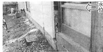
昨年8月24日夜深1時から1時間54ミリのゲリラ豪雨。雨水は地面から78cmまで上昇。幸町、有明町、西町、扇町で住宅に浸水