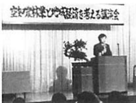
2/28のTPP講演会に250人が参加