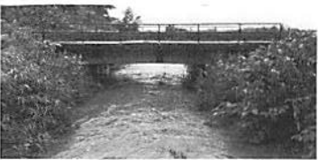
昨年8月ゲリラ豪雨の江部乙川。増水で函館本線の線路下土砂を崩す危険性があります。川の拡幅を国・道に求めます。