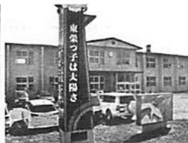
24年度東小に統合される東栄小。東滝川に子育て世代減少の危機