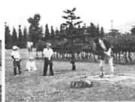
パークゴルフは高齢者の健康を守っているのに年間の予算は90万円以下です