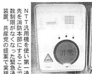
N・T・T汎用機を使い第一通報先を消防本部にすることで台数制限がなくなった緊急通報装置。共産党の提案で実現