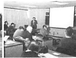
総合福祉センターで学習会。道内他市町村との比較や、市税務課の無法な差押えが報告されました